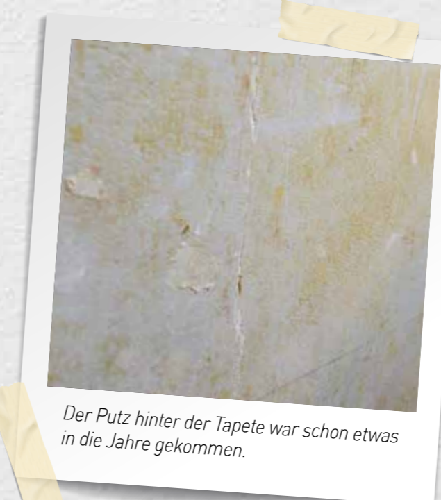
Der Putz hinter der Tapete war schon etwas in die Jahre gekommen.

In Eigenleistung und mit etwas fachmännischer Unterstützung eines befreundeten Malermeisters ging es schließlich ans Werk: Die Untergrundvorbereitungen konnten nach dem Abziehen der alten Tapeten