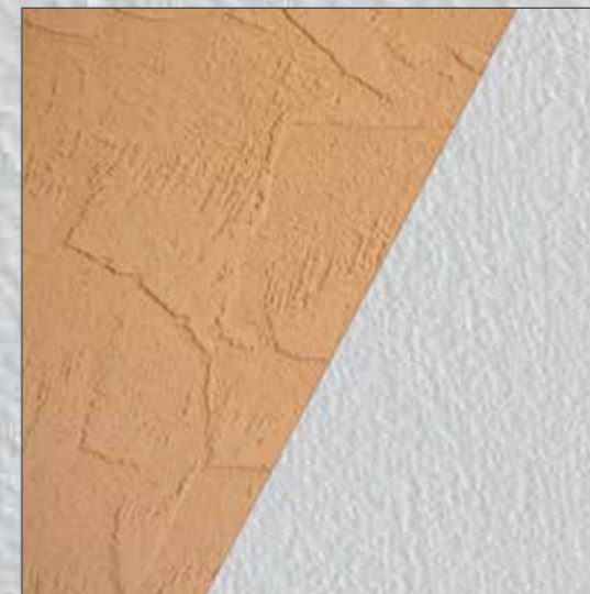
Strukturputze (bis 2 mm): direkt übertapezieren.