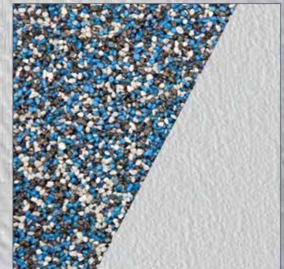
Buntsteinputz (bis 2 mm): grundieren und übertapezieren.