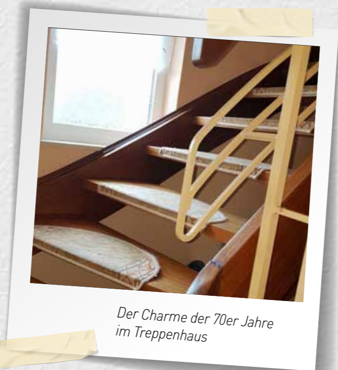
Der Charme der 70er Jahre im Treppenhaus

Während in den Wohn- und Schlafräumen mit viel Motivation bis ins kleinste Detail neu gestaltet, umgebaut und dekoriert wurde, sollte das Treppenhaus einfach schnellstens seinem Zweck dienlich sein und