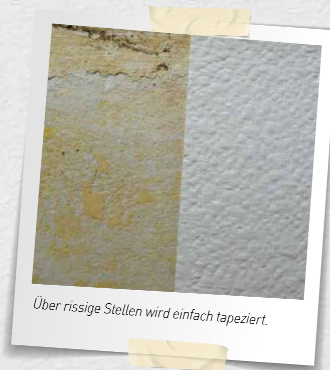
Über rissige Stellen wird einfach tapeziert.