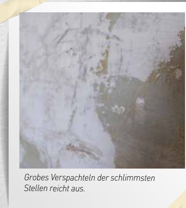
Grobes Verspachteln der schlimmsten Stellen reicht aus.

Die Entscheidung fiel dann schnell auf SYSTEXX Active Reno SP38 , da es neben der optischen Kaschierung von Unebenheiten auch gleich vorpigmentiert ist und damit bei der gewünschten weißen Beschichtung nur ein Anstrich nötig sein wird.