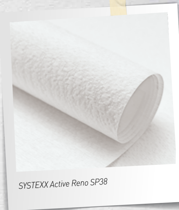
SYSTEXX Active Reno SP38

Die schnelle und unkomplizierte Renovierung schien in weite Ferne zu rücken.