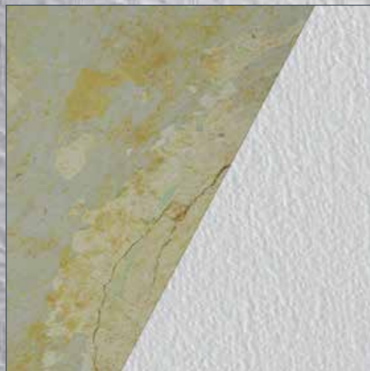
Risse: Lose Stellen entfernen, grundieren, übertapezieren.

Je nach Untergrundbeschaffenheit sind für ein optimales Ergebnis verschiedene kleinere Vorbereitungen notwendig. Auf dieser Seite sehen Sie eine Auswahl der häufigsten Probleme und zu überarbeitenden Untergründe, die Sie mit SYSTEXX Active Reno zeitsparend renovieren können.