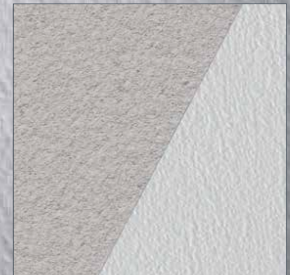
Rauputze (bis 2 mm): direkt übertapezieren.