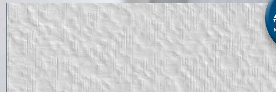
SYSTEXX Active Reno SP38