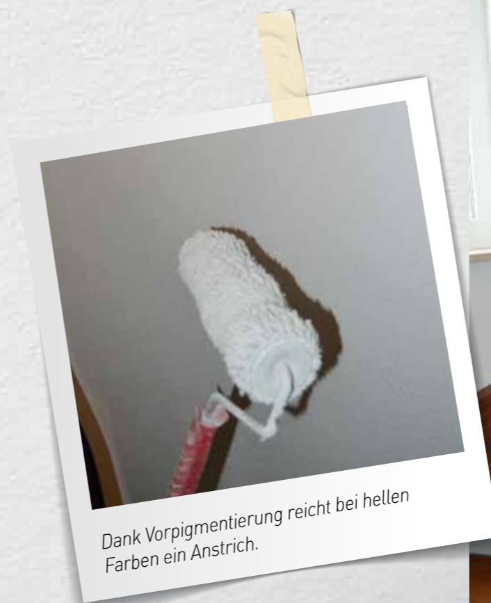
Dank Vorpigmentierung reicht bei hellen Farben ein Anstrich.

Das Vitrolan Team wünscht den neuen Hausherrn alles Gute und eine glückliche Zeit im neuen Eigenheim!