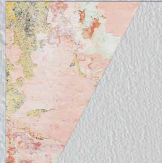
Alte Tapeten: Lose Teile ablösen, grundieren und übertapezieren.