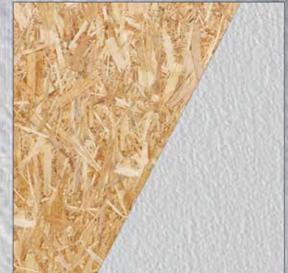
OSB-Platten: Sperrgrund auftragen und anschließend übertapezieren.