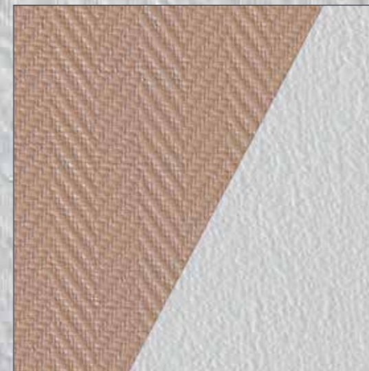
Altes Glasgewebe: direkt übertapezieren.