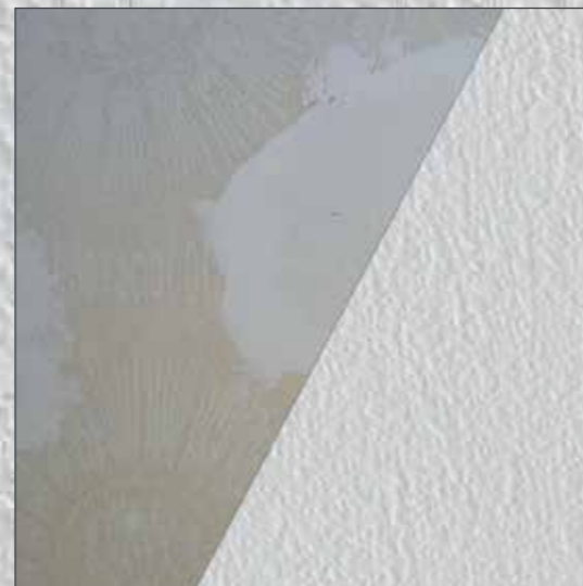
Unebenheiten (bis 2 mm): direkt übertapezieren.